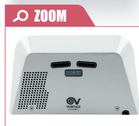
Vue de dessous - Buses de soufflage